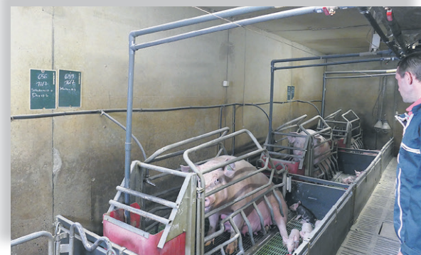
L'éleveur a ajouté une arrivée d'eau sur la descente de soupe. Une vanne permet de gérer l'abreuvement à la truie.

Laurent Coupé, éleveur à Pluduno (Côtes d'Armor), a installé des vanes d'eau dans toutes ses maternités pour pouvoir abreuver automatiquement les truies sans porter de seau. Pour chaque truie, le circuit d'eau est raccordé à la descente de soupe, ce qui permet également de la rincer à chaque distribution. L'éleveur a réalisé cet aménagement pour faciliter le travail. "Depuis 2-3 ans, je distribuais de l'eau aux truies en leur apportant des seaux d'eau. Fin 2018, j'ai embauché une salariée d'une vingtaine d'années. Quand je l'ai vue porter les seaux entre le couloir et la maternité, je me suis dit que ce n'était pas sérieux, qu'on n'allait pas continuer comme ça. Je ne voulais pas d'un tuyau d'arrosage qui aurait traîné par terre et empêché de fermer les portes, et je voulais que ce soit facile : plus les choses sont faciles à faire, mieux elles sont faites". L'éleveur a donc aménagé une maternité de 8 places, puis les suivantes. "Il faut prévoir une petite journée de